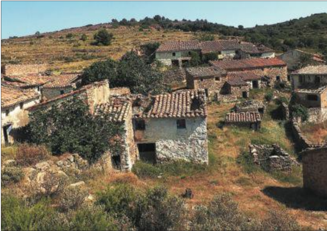
El mas de la Reduela, en Ludiente, comarca de l'Alt Millars.