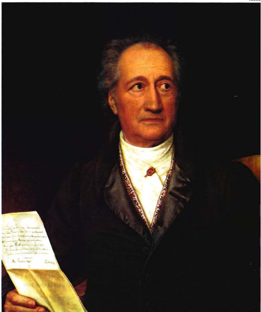
Retrat de Johann Wolfgang Goethe per Joseph Stieler.

Les dues primeres parts de l'obra, que narren el recorregut fins a Sicília, pel seu caràcter instantani i la seua unitat, resulten les pàgines més fresques, mentre que l'última (la segona estada a Roma), per ser més fragmentària, ja no ho és tant. Alguns dels moments que més m'han agradat són els dedicats a Vero-