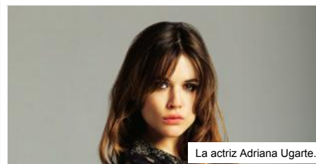
La actriu Adriana Ugarte.