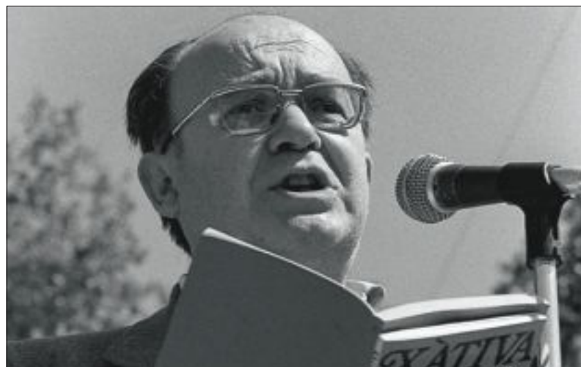
El poeta Vicent Andrés Estellés, l'any 1981.

La primera aportació de Carbó és aclarir l'ordre cronològic del període estudiat ja que la distribució de les Obres completes és caòtica i no sempre resulta fàcil fer-se una idea de l'evolució